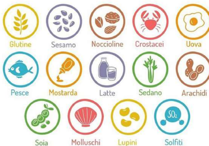
TABELLA DI TUTTI I POSSIBILI ALLERGENI PRESENTI

Il nostro Staff sarà lieto di presentarvi la carta dei vini.